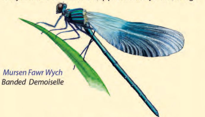
Mursen Fawr Wych Banded Demoiselle

This is a linear path along green lanes that link two of Carmarthenshire's most picturesque and historically interesting settlements. Most of the route is over gently undulating ground with only a couple of short sections of moderately steep ground. It is just over three miles (approximately 5km) long.