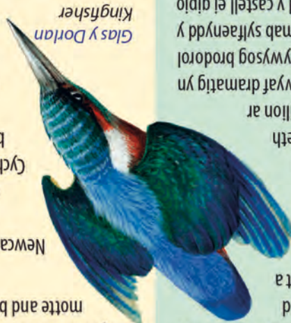
Glas y Dorlan Kingfisher