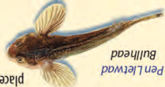
Bullhead Pen Letwad

Newcastle Emlyn owes its foundation and its name to the castle built by Maredudd ap Rhys Gryg in 1240 to establish his control of the lordship of Emlyn Uwch Cych. The castle, the ruins of which can be seen on the banks of the Teifi, was involved in some of the most dramatic events in Welsh history. It was a final stronghold of the last native prince of West Wales, Rhys ap Maredudd (a son of the castle's builder), who was executed in 1292. In 1403, it was captured by Glyndwr's men during his War of Independence. It was finally blown up by Cromwell's forces after the end of the Civil War in 1648. Throughout those troubled centuries, the town survived and during more peaceful times grew into an important centre of local trade and commerce. Today, Newcastle Emlyn is a busy market town with many places of interest, from shops and inns to its church, chapels and other public buildings.