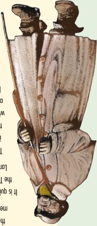
Cerfion Portman Drovers' Statue

The River Tywi which has its origins high in the hills