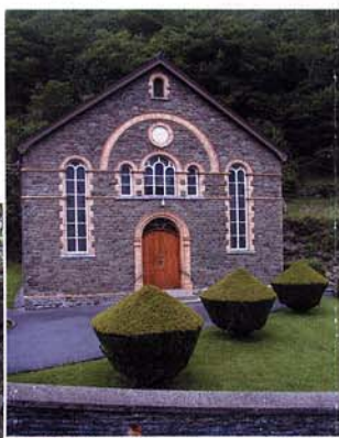
Capel Soar Soar Chapel

Trafnidiaeth Gyhoeddus. Yng Nghaerfyrddin y mae'r orsaf drenau agosaf. Mae gwasanaethau bysiau rheolaidd ar gael o Gaerfyrddin ac o Gastell Newydd Emlyn i Dre-fach Felindre. I gael y wybodaeth ddiweddaraf am y Gwasanaethau Trafnidiaeth Gyhoeddus Ledled Cymru ffoniwch 0870 6082 608. Mae'r llwybr hwn yn un o gyfres Llwybrau Sir Gaerfyrddin. I gael rhagor o wybodaeth am y llwybrau yn y gyfres cysylltwch a'r: Uned Hamdden Cefn Gwlad. Ty'r Nant, Parc Busnes Trostre, Llanelli. SA14 9UT. Ffon: (01554) 747500 www.sirgar.gov.uk