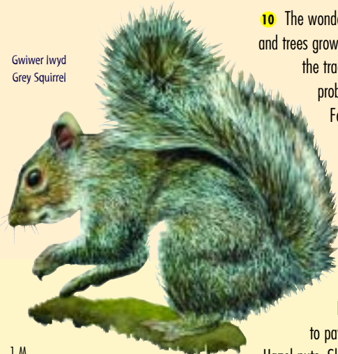
Gwiwer Iwyd Grey Squirrel

Llwybrau a Argymhellir Hawliau Tramwyr Eraill