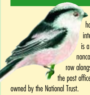
Titw gynffon hir Long Tailed Tit

10 Mae'r amrywiaeth rhyfeddol o redyn, blodau, llwyni a choed sy'n tyfu ar hyd y cloddiau o boptu i'r llwybr yn dystiolaeth fod y cloddiau yma yn gannoedd o flynyddoedd oed. Mae'r Farchredynen Fenyw a'r Farchredynen Wryw sy'n llawer cryfach, yn ffynnu yn y cysgodion tra mae'r Hopys Gwyllt ym ymgordeddu o amgylch y llwyni talach. Mae'r Bysedd Cŵn, Fioledau a Brenhines y Weirglodd yn ymbalfalu am le rhwng Moron y Meirch, y Troedrudd, y Cynghafan a'r Fafonen Ddu. Byddai'r rhai hynny sy'n ymddiddori mewn bwyd gwyllt yn mwynhau ymweld â'r ardal hon ddiwedd yr haf i gasglu cnau cyll, eirin duon bach, egroes a mwyar duon.