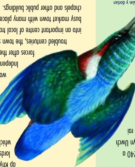
Glas y dorian Kingfisher

busy market town with many places of interest, from shops and inns to its church,