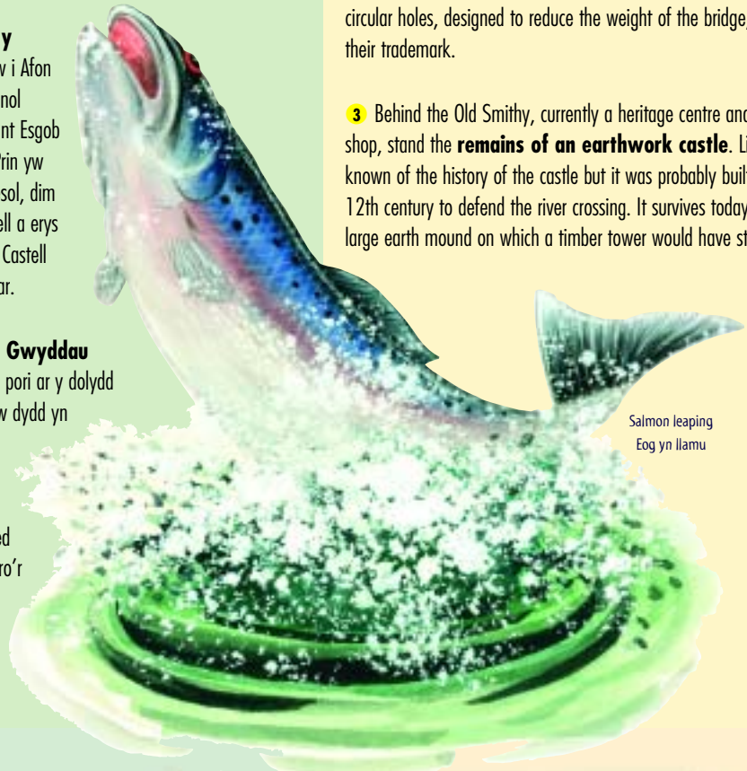
Salmon leaping Eog yn llamu

9 Canada Geese can often be seen grazing the meadows opposite the castle. By day, during the summer months, Sand Martins and Swallows hunt insects over the river. These are replaced at dusk by bats.